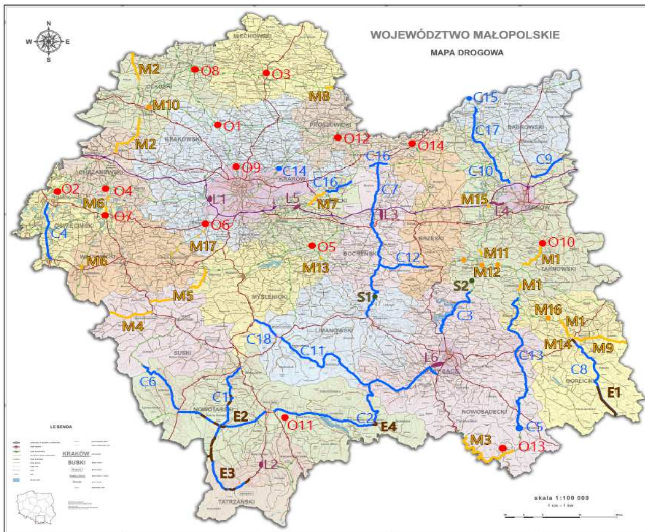
Rys.2. Planowane inwestycje drogowe w Małopolsce do roku 2023.